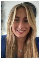
Danniek Groep 1-2b en c